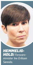
HEMMELIG-HOLD: Forsvarsminister Ine Eriksen Søreide.

Men nå har hun stilt seg lagelig til for hogg. Hun anklages for manglende akteske for Stortinget. «Dette er det verste jeg har vært med på», sa komitéens leder, Martin Kolberg fra Arbeiderpartiet. Komitéen vil umiddelbart akkrevre statsråden forklaring på hvorfor hun lot den ene rapporten ligge i fem måneder mens komitéen hadde våpensalgene til Nigeria, Kamerun, Sudan og Eritrea til behandling. Søreide sier til NTB at hun var opptatt av å «kvalitets-sikre» rapporten for Stortinget fikk den.